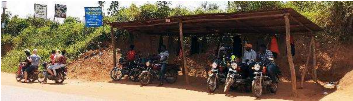
Op de Boda Boda de berg op